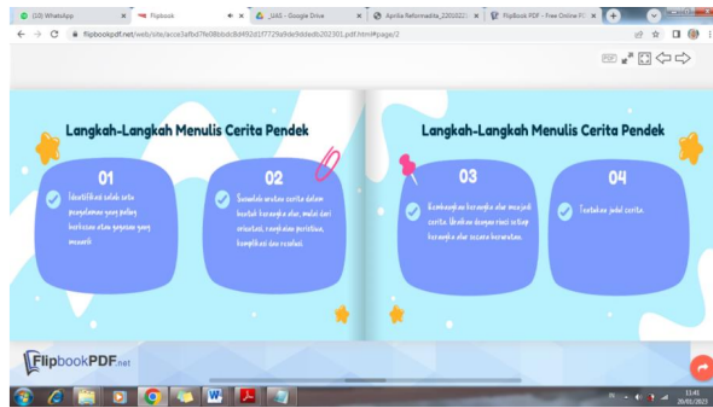
Gambar 3. Media Flipbook