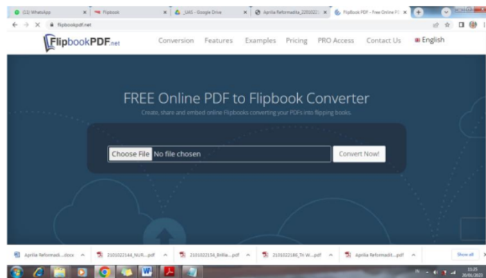
Gambar 1. Tampilan pembuatan Flipbook

Flipbook dapat dibuat dengan mengunggah fail PDF pada menu “Choose Fail” lalu tekan “Convert Now”. Selanjutnya akan muncul tautan flipbook yang dapat digunakan. Misalnya tautan berikut.