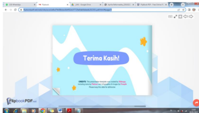
Gambar 3. Media Flipbook

Penelitian sebelumnya yang dilakukan oleh Luh Nuryani et al. (2021) tentang Media Pembelajaran Sistem Pernafasan Manusia Materi Flipbook Pada Materi IPA Untuk Peserta didik Kelas V Sekolah Dasar, menunjukkan bahwa pembelajaran yang kurang menarik seringkali membuat peserta didik merasa bosan dan pada akhirnya tidak fokus pada pembelajaran. sedang belajar. sedang belajar. Penelitian pengembangan ini bertujuan untuk mengembangkan desain media pembelajaran flipbook untuk materi Sistem Pernafasan Manusia pada materi IPA untuk Peserta didik Kelas V Sekolah Dasar. Hasil penilaian ahli media pembelajaran dari penilaian ahli materi pembelajaran diperoleh persentase skor (98%) dengan kualifikasi sangat baik, hasil penilaian ahli media pembelajaran diperoleh persentase skor (93%) dengan kualifikasi sangat baik, hasil penilaian ahli desain pembelajaran diperoleh persentase skor (92,5%) dengan kualifikasi sangat baik, dan dari mata pelajaran uji individu peserta didik memperoleh persentase skor (95%) dengan kualifikasi sangat baik. Dari hasil uji