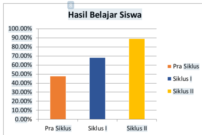
Grafik 1. Perbedaan Hasil Belajar Siswa Pada Pra Siklus, Siklus I dan Siklus II

Hasil observasi menunjukkan bahwa penggunaan media PPT interaktif melalui pendekatan CRT berdampak positif pada aktivitas mengajar guru dan belajar siswa. Pada siklus I, aktivitas mengajar guru berada pada kategori cukup dengan persentase 71,43%. Namun, pada siklus II, aktivitas mengajar guru meningkat secara signifikan menjadi 94,64% (kategori sangat baik). Guru lebih terampil dalam memanfaatkan media PPT interaktif dan mengaitkan materi dengan konteks budaya siswa. Selain itu, aktivitas belajar siswa juga mengalami peningkatan, dari 68,18% (kategori cukup) pada siklus I menjadi 95,45% (kategori sangat baik) pada siklus II, menunjukkan bahwa siswa lebih aktif dan terlibat dalam pembelajaran.