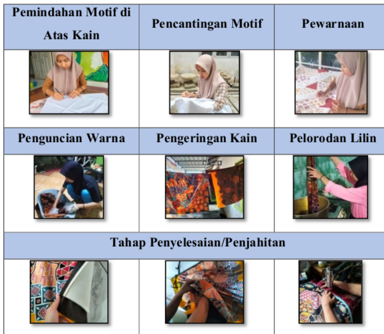
Tabel 1. Proses Penciptaan Karya

Selanjutnya pemindahan sketsa di atas kain menggunakan pensil yang nantinya akan masuk pada tahap pencantingan motif. Pada tahap ini proses pencantingan menggunakan malam /lilin pada kain.