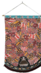
Gambar 8. Sekar Jagad Sumatera Utara 6