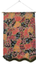
Gambar 5. Sekar Jagad Sumatera Utara 3