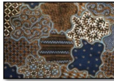
Gambar 1. Batik Motif Sekar Jagad