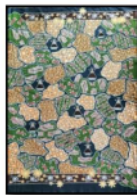
Gambar 13. Sekar Jagad Sumatera Utara 11