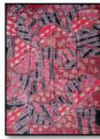
Gambar 9. Sekar Jagad Sumatera Utara 7