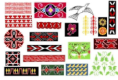
Gambar 2. Motif Sumatera Utara