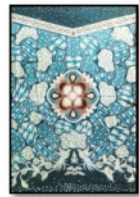
Gambar 11. Sekar Jagad Sumatera Utara 9