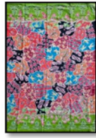
Gambar 10. Sekar Jagad Sumatera Utara 8