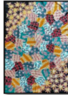
Gambar 12. Sekar Jagad Sumatera Utara 10