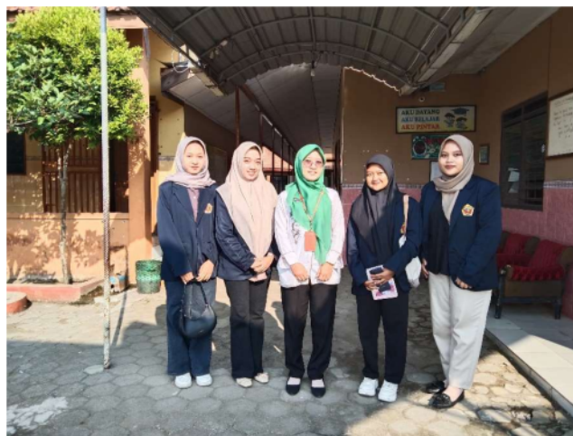
Gambar 2 Mahasiswa dan Ibu DS

Berdasarkan wawancara yang dilakukan bersama Ibu DS selaku guru kelas V SD 4 Gondang Manis, hasil analisis menunjukkan siswa menunjukkan minat yang tinggi pada metode ini dengan ditandai adanya peningkatan yang signifikan dalam pemahaman materi. Mereka telah mampu berkolaborasi secara efektif dalam kelompok kecil, saling bertukar pendapat, dan mengemukakan argumen mereka dengan jelas. Adapun aspek yang diamati, yaitu pemahaman konsep, strategi, dampak, factor pendorong dan tantangan.