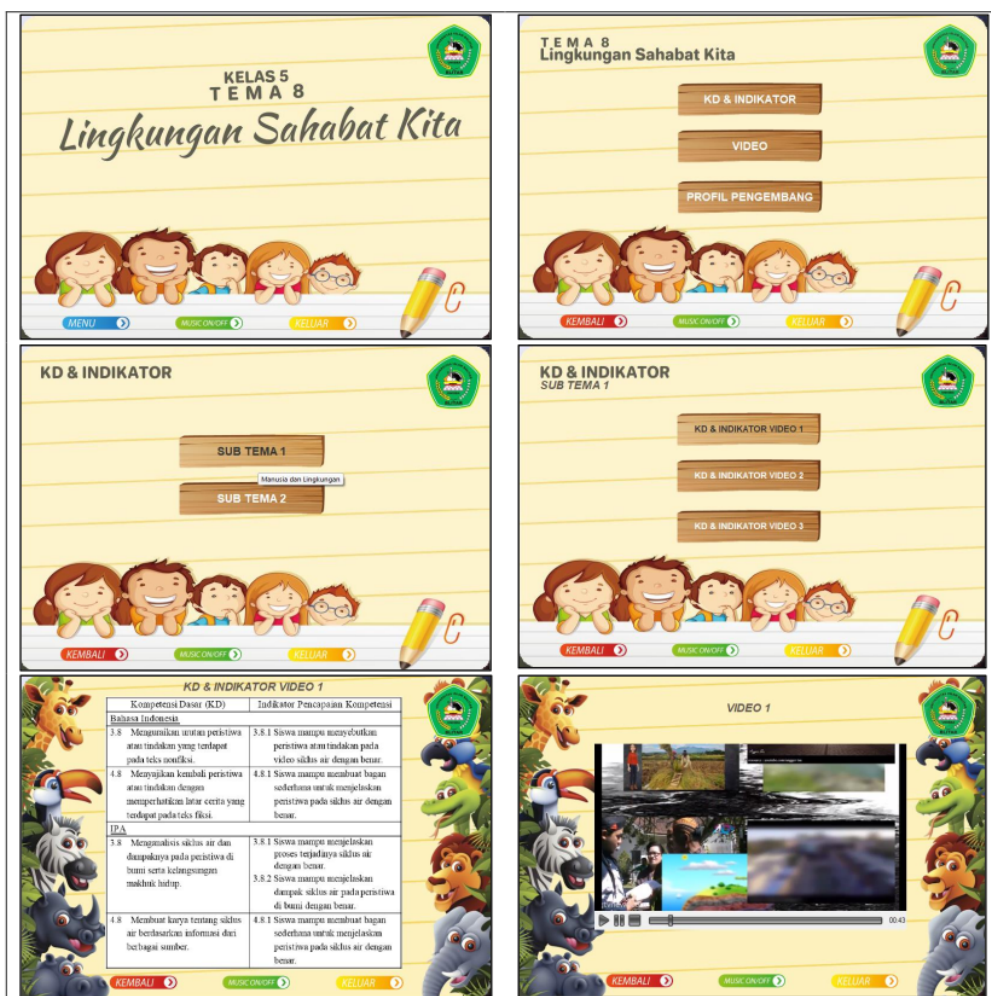
Gambar 1. Desain Produk Video Tematik

Media Studio 8. Berikut tampilan media video pembelajaran tematik untuk keterampilan berdiskusi sebelum divalidasi oleh para ahli.