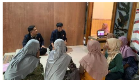
Gambar 4. Kegiatan Wawancara

Hal ketiga yang dilakukan yaitu wawancara para pelaku UMKM. Pada sesi wawancara tersebut tim pengabdian menanyakan terkait kondisi dan cara pengelolaan keuangan usaha sebelum menggunakan Bukalapak. Wawancara ini bertujuan sebagai bentuk informasi yang memungkinkan dapat membantu tim pengabdian dalam memberikan solusi sesuai dengan masalah yang dialami.