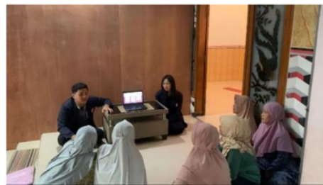
Gambar 3. Kegiatan Pemaparan Materi

Hal kedua yang dilakukan yaitu pemaparan materi. Tim pengabdian menjelaskan tentang tata cara aplikasi buka lapak. Tata cara penggunaan aplikasi Bukalapak diinstruksikan secara sistematis dari awal hingga akhir. Tim pengabdian memberikan penjelasan beberapa layanan didalam aplikasi yang memiliki fungsi berbeda-beda. Dari aplikasi Bukalapak dapat disimpulkan bahwa manfaat yang didapat sangat berpengaruh untuk perkembangan usaha.