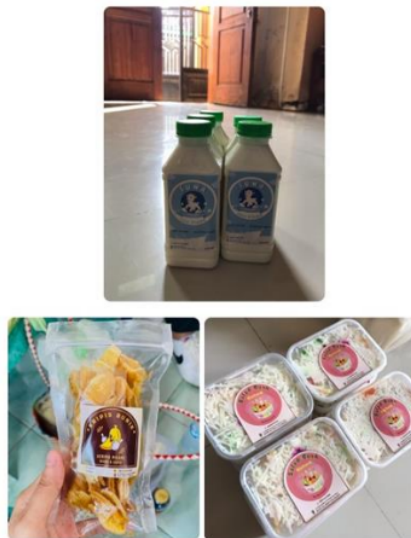
Gambar 2. Percetakan Logo Pada Produk UMKM

Dalam proses menyelenggarakan bazar ini, mahasiswa pengabdian masyarakat memperhatikan secara detail terkait potensi-potensi UMKM yang ada di Desa Mlorah dengan melakukan survey dan pendekatan door to door kepada para pelaku UMKM. Pendekatan ini dianggap sangat efektif untuk mengetahui permasalahan-permasalahan pada setiap pelaku usaha. Memberikan wawasan terkait kelayakan untuk unjuk produk dengan membantu pembuatan dan percetakan logo, pembuatan Nomor Induk Berusaha (NIB), dan drop point google , beberapa proses ini dianggap membantu rasa percaya diri dan meningkatkan kembali semangat untuk mengembangkan produk usahanya.