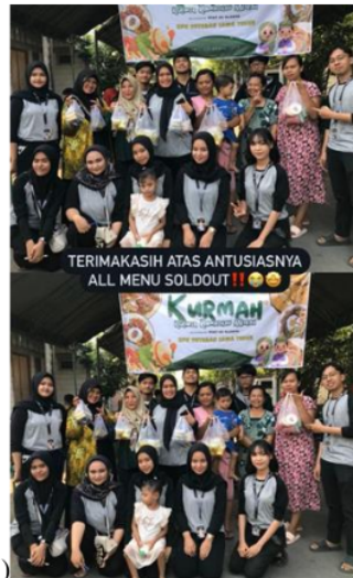
Gambar 5. Dokumentasi Bersama Warga