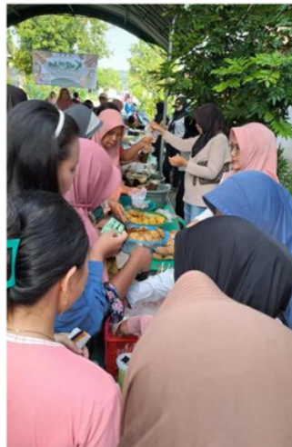
Gambar 4. Keramaian Bazar Kurmah

Respon dan dukungan juga diberikan penuh oleh masyarakat Desa Mlorah, yang merupakan sasaran dari bazar ini. Hal ini dapat dilihat dari antusias masyarakat Desa Mlorah yang berbondong-bondong dalam menghadiri dan memeriahkan bazar KURMAH tanpa adanya paksaan dari pihak manapun.