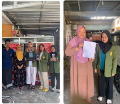
Gambar 3. Pembuatan NIB dan Gmaps