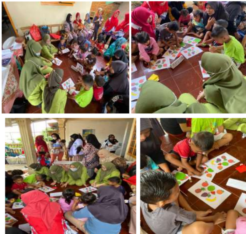
Gambar 1. Kegiatan Terapi Bermain Puzzle Sederhana

1 Setelah terapi puzzle, seluruh responden mengalami perkembangan motorik halus yang baik. Anak usia 4 dan 5 tahun dapat berhasil memecahkan teka-teki tanpa bantuan, termasuk menempatkan teka-teki tersebut pada potongan pertama yang disediakan. Hal ini dikarenakan dengan menggunakan media puzzle dalam kegiatan pembelajaran, anak mendapat masukan ilmu untuk dihafal, sehingga menggunakan media puzzle sebagai terapi bermain dalam pembelajaran (Nuliana, 2022)