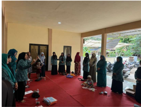
Gambar 2 Pertemuan dengan anggota ibu PKK desa Lenteng Timur di Balai Desa

Hasil pretest menunjukkan masih kurangnya kesadaran masyarakat terhadap keunggulan tanaman TOGA. Banyaknya manfaat yang dimiliki tanaman TOGA bahkan masih belum banyak diketahui oleh masyarakat, bahkan belum mampu merintis usaha baru di industri minuman karena mereka hanya mengenalnya sebagai bumbu kuliner yang digunakan hanya untuk memasak. Materi sosialisasi kepada tim pengabdian meliputi informasi mengenai pengertian, varietas, dan keunggulan tanaman TOGA.