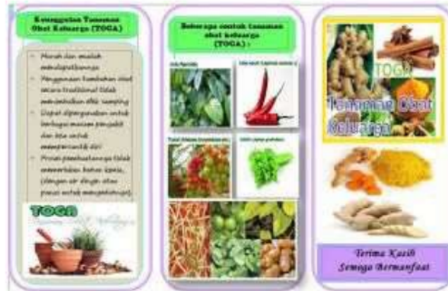
Gambar 3 Pamflet tentang keunggulan tanaman TOGA