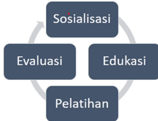
15 Gambar 1. Diagram proses atau metode kegiatan pengabdian