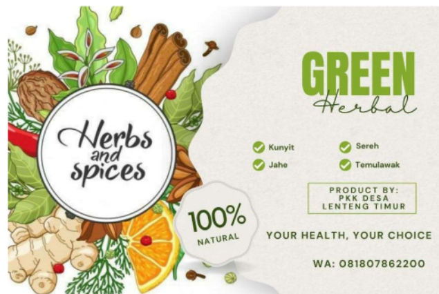
Gambar 4 Pembuatan Label pada produk serbuk minuman herbal

Materi konseling disampaikan secara interaktif, sehingga khalayak umum dapat bertanya dan memberikan komentar saat disampaikan. Melalui peningkatan fokus dan penyerapan konten, latihan interaktif ini dapat membantu masyarakat belajar lebih banyak dan merasa lebih nyaman saat menerima informasi. Usai penyampaian materi, dilakukan sesi tanya jawab setelah pemaparan materi. Tujuan dari sesi ini adalah untuk bertukar informasi mengenai kasus-kasus lapangan yang relevan dengan masyarakat dan dapat digunakan untuk meningkatkan pemahaman warga melalui diskusi. Peserta dapat bertanya dan memberikan masukan mengenai keunggulan tanaman TOGA pada sesi ini. Antusiasme masyarakat terhadap