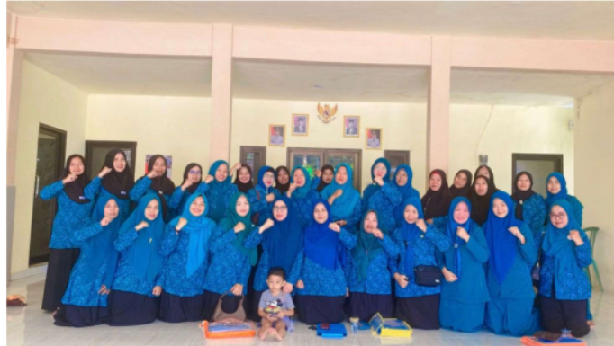
Gambar 6 Penutupan kegiatan Bersama dengan ibu PKK desa Lenteng Timur

Diharapkan setelah selesai melakukan latihan ini, peserta sosialisasi dapat memanfaatkannya. Kemampuan membuat minuman herbal yang aman, cara pandang usaha tanaman TOGA menjadi minuman bubuk herbal, serta kemampuan berbagi ilmu dan pemahaman yang diperoleh dari kegiatan ini mengenai pembuatan minuman herbal dari tanaman TOGA kepada keluarga dan masyarakat sekitar merupakan luaran dari edukasi ini dan pelatihan.