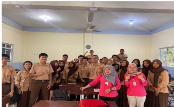
Gambar 2. Foto bersama Peserta kader sekolah yang dipilih untuk mengikuti pelatihan pengecekan Kesehatan