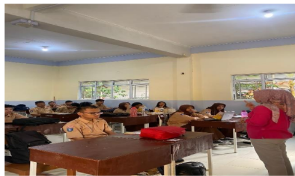
Gambar 3. Monitoring kegiatan yang sedang berlangsung/melakukan pengecekan kesehatan pada siswa lain

Pada gambar 3 adalah kegiatan monitoring pada saat kader melakukan pengecekan kesehatan pada klien disekolah/teman sebaya. Program ini dibentuk dalam upaya pencegahan stunting yang sedang mengalami fluktuatif diindonesia. Dengan adanya program mampu mengatasi penyakit stunting sejak dini sebelum memasuki jenjang kategori dewasa yang merupakan suatu penyakit stunting tersebut dapat memperburuk kesehatan tubuh yang lainnya.