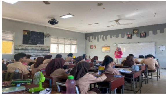
Gambar 1. Penyuluhan kesehatan dalam PKPR

Gambar 1 dan Gambar 2 adalah kegiatan pelaksanaan program