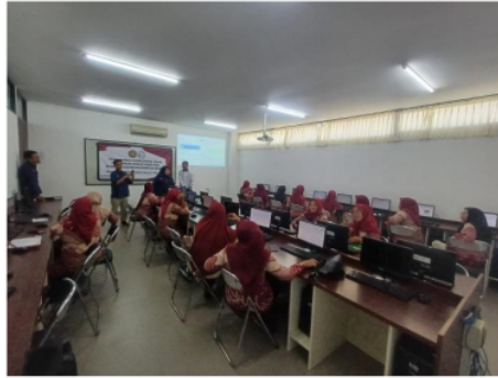
Gambar 2. Praktik menggunakan google forms

Pelatihan diadakan dalam bentuk workshop dengan praktik langsung. Warga membuat Google Forms sederhana. Setiap peserta diberikan kesempatan untuk langsung mencoba membuat form, menambahkan pertanyaan, dan mengatur tampilannya. Simulasi dan latihan yang realistis untuk mempersiapkan warga menggunakan Google Forms dalam kehidupan sehari-hari, seperti membuat survei komunitas atau pengumpulan data.