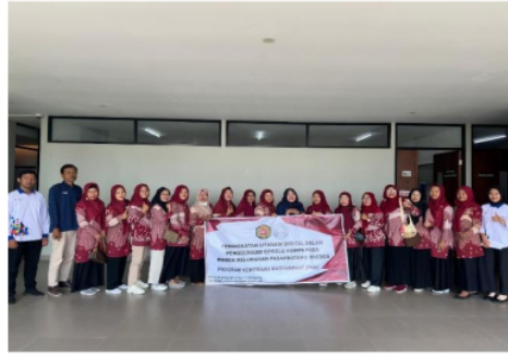
Gambar 6. Foto bersama peserta PKM dengan Panitia PKM