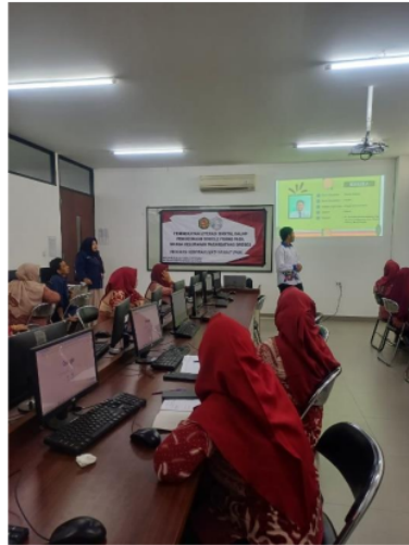
Gambar 4. Mentoring peserta dalam membuat google forms

Pengumpulan umpan balik dari peserta melalui kuesioner dan wawancara singkat untuk mengevaluasi efektivitas pelatihan dan mengidentifikasi area perbaikan. Penyediaan sesi lanjutan dan konsultasi untuk peserta yang memerlukan bantuan tambahan. Membuat grup diskusi online untuk mendukung pembelajaran berkelanjutan dan berbagi pengalaman.