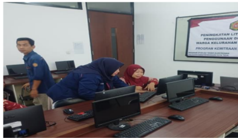
Gambar 3. Pendampingan peserta saat pelaksanaan

Pelatihan diadakan dalam bentuk workshop dengan praktik langsung. Warga membuat Google Forms sederhana. Setiap peserta diberikan kesempatan untuk langsung mencoba membuat form, menambahkan pertanyaan, dan mengatur tampilannya. Simulasi dan latihan yang realistis untuk mempersiapkan warga menggunakan Google Forms dalam kehidupan sehari-hari, seperti membuat survei komunitas atau pengumpulan data.