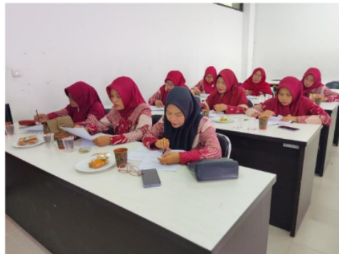
Gambar 5. Pengisian Kuesioner

Pengumpulan umpan balik dari peserta melalui kuesioner dan wawancara singkat untuk mengevaluasi efektivitas pelatihan dan mengidentifikasi area perbaikan. Penyediaan sesi lanjutan dan konsultasi untuk peserta yang memerlukan bantuan tambahan. Membuat grup diskusi online untuk mendukung pembelajaran berkelanjutan dan berbagi pengalaman.