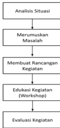
Gambar 1. Diagram

Pelaksanaan kegiatan pengabdian kepada masyarakat dilakukan melalui beberapa tahapan. Tahapan yang dilakukan dalam kegiatan pengabdian kepada masyarakat ini akan dijelaskan dalam diagram, sebagai berikut: