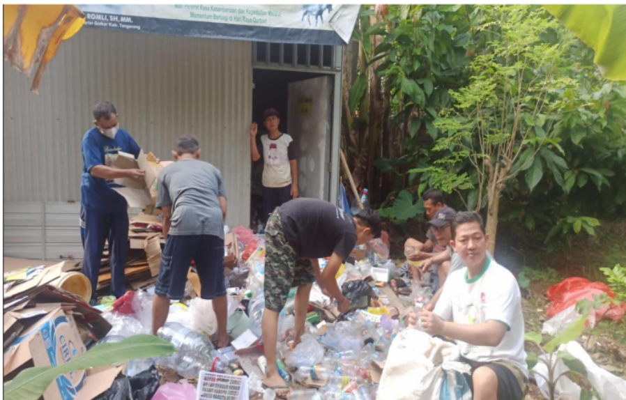
Gambar 3. Antusiasme Masyarakat Pada Workshop 5S