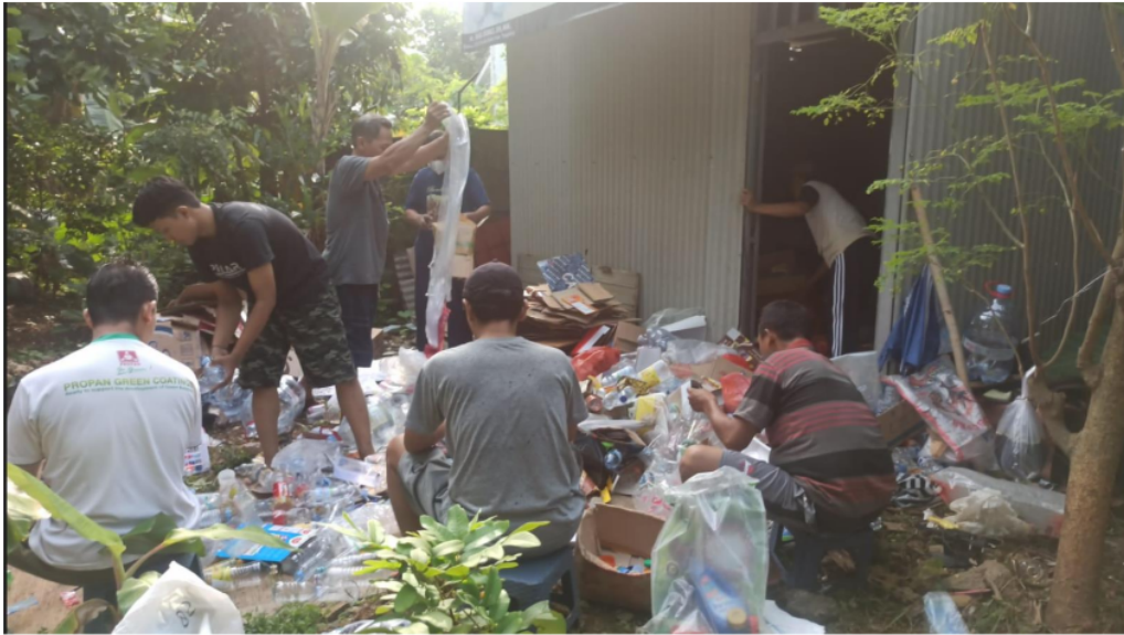
Gambar 2. Pelaksanaan Workshop