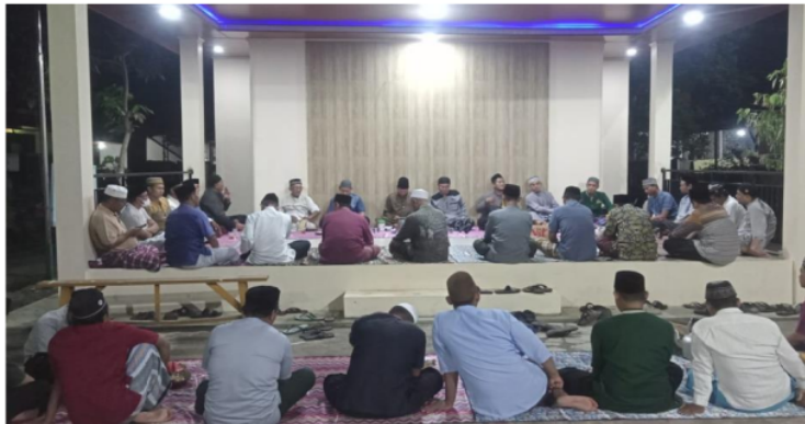
Gambar 4. Ramah Tamah Dengan Masyarakat

Penulis jurnal secara khusus mengucapkan terimakasih banyak kepada bapak RT dan RW serta seluruh warga yang telah memfasilitasi dan berkontribusi dalam kegiatan pengabdian masyarakat. Terimakasih juga kami sampaikan kepada masyarakat perumahan yang telah berpartisipasi aktif dalam kegiatan ini.