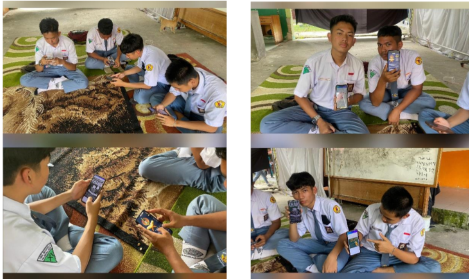
Gambar 6. Kegiatan pembuatan poster

Pada gambar 6, adalah proses kegiatan mempelajari cara penggunaan aplikasi Canva menggunakan smartphone masing-masing sekaligus pembuatan poster larangan minuman keras secara langsung oleh siswa kelas XI 2.