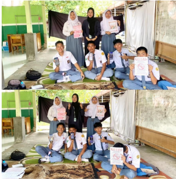
Gambar 10. Sesi terakhir foto bersama para siswa kelas XI 2

Pada gambar 9 dan 10 di atas merupakan sesi akhir dari kegiatan pengabdian “MBKM Asistensi Mengajar: Penguatan Larangan Minuman Keras bagi Siswa melalui Poster Berbasis Canva di SMAN 2 Palangka Raya”.