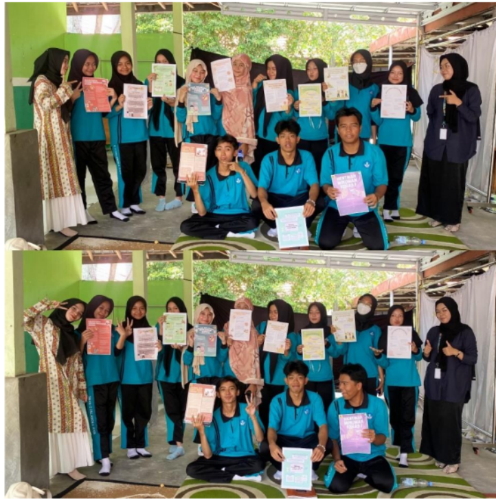
Gambar 9. Sesi terakhir foto bersama para siswa kelas XI 3

Sesi terakhir dari rangkaian pengabdian yakni foto bersama dengan menunjukkan poster-poster larangan minuman keras berbasis Canva oleh siswa kelas XI 3.