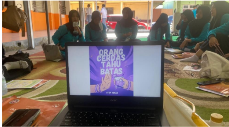
Gambar 4. Contoh editing poster berbasis Canva

Pada gambar 4, adalah salah satu contoh poster yang dibuat menggunakan aplikasi Canva sebagai acuan pembuatan poster larangan minuman keras yang akan dikerjakan oleh siswa kelas XI 3.