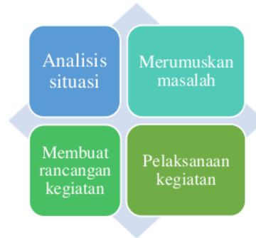
Gambar 1. Diagram Metode Pengabdian

Pelaksanaan metode ini melalui tahapan yang dijelaskan dalam diagram di samping kanan (Sulistia Wati, 2024), sebagai berikut: