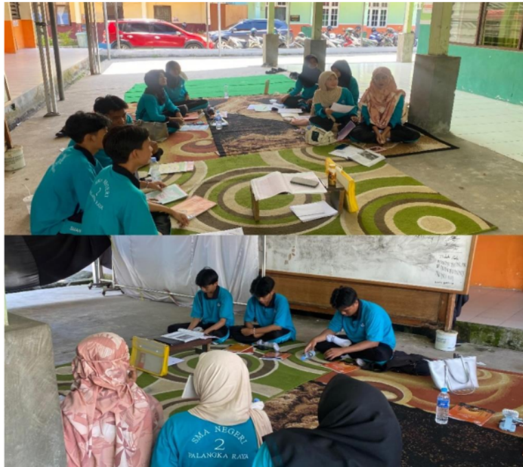
Gambar 5. Suasana kegiatan pembelajaran

Pada gambar 4, adalah salah satu contoh poster yang dibuat menggunakan aplikasi Canva sebagai acuan pembuatan poster larangan minuman keras yang akan dikerjakan oleh siswa kelas XI 3.