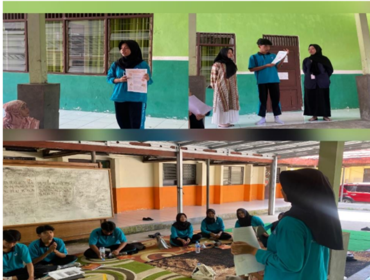
Gambar 7. Penyampaian poster dari siswa kelas XI 3