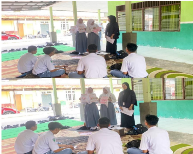
Gambar 8. Penyampaian poster dari siswa kelas XI 2

Setelah kegiatan pelatihan pembuatan poster, siswa melakukan demonstrasi kampanye poster yang telah tersedia seperti yang dilakukan oleh perwakilan siswa dari kelas XI 3 dan kelas XI 2 di atas ini.