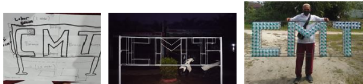
Gambar 7. Kerangka Besi sebagai Icon Desa Cempaka Mulia Timur