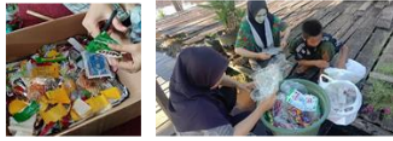
Gambar 3. Proses Pengumpulan dan Pembersihan Sampah Plastik