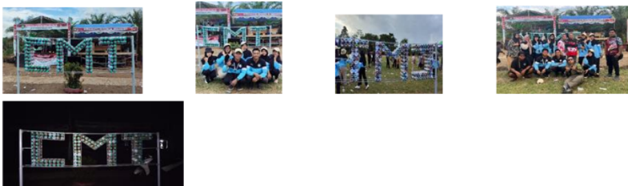
Gambar 8. Pemasangan Ecobrick Icon Desa Cempaka Mulia Timur