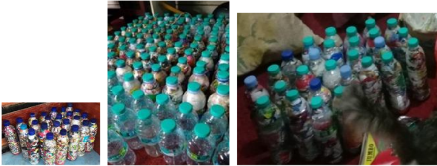
Gambar 6. Botol Mineral terisi penuh Sampah