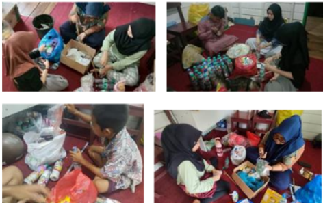
Gambar 5. Proses Memasukkan Sampah Plastik ke dalam Botol Mineral