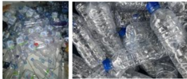
Gambar 2. 11 Proses Pengumpulan Botol Mineral Bekas