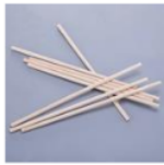
Gambar 4. Contoh tongkat panjang yang digunakan untuk memasukkan sampah