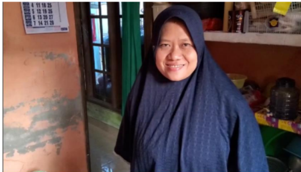
Gambar 4. Interview dengan salah satu pengelola