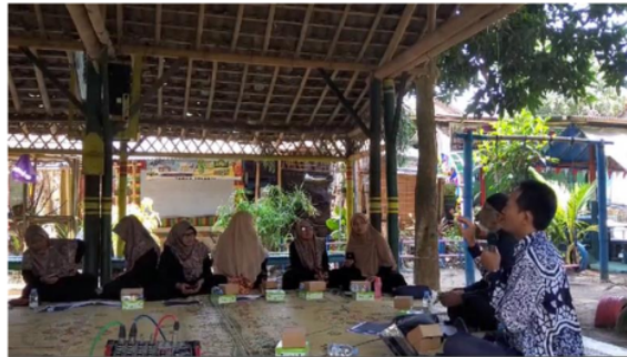
Gambar 3. Penyampaian materi pemasaran digital