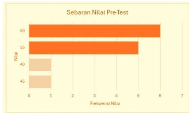
Gambar 1. Sebaran nilai test peserta pelatihan sebelum mengikuti pelatihan.

Keberhasilan program tersebut juga dinilai dari penguasaan peserta terhadap materi yang diajarkan dan kemampuan mereka untuk mengaplikasikannya dalam situasi nyata. Berdasarkan hasil evaluasi pre-test and post-test selama pelatihan, dapat disimpulkan bahwa terdapat peningkatan yang signifikan dalam pemahaman dan keterampilan peserta setelah.