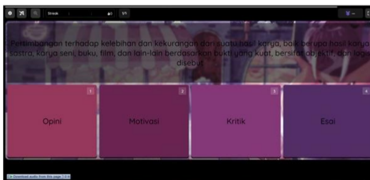
Gambar 1. Tampilan awal Quizizz

Penerapan alat evaluasi menggunakan Quizizz dalam pembelajaran bahasa Indonesia teks artikel pada kelas XII SMA bisa menambah motivasi dan juga keterampilan dalam menggunakan teknologi serta meningkatkan kreativitas siswa dalam memecahkan masalah. Hal ini dikarenakan media memberikan stimulus terhadap peserta didik dan interaktif direspons dengan sangat baik oleh peserta didik baik secara aktif, efektif maupun kognitif. Peningkatan motivasi belajar intrinsik di dapatkan rata-rata nilai prosentase sebesar 81.47%, dengan jenjang kenaikan yang tinggi sedangkan pada peningkatan motivasi belajar Ekstrinsik di dapatkan rata-rata nilai prosentase sebesar 87.82% dengan kenaikan jenjang tinggi. Dapat disimpulkan dalam penelitian terdahulu oleh (Titin & Kurnia, 2022) bahwa pembelajaran akan lebih bermanfaat dan bermakna jika dalam prosesnya menggunakan media dalam memberikan informasi materi terhadap peserta didik.