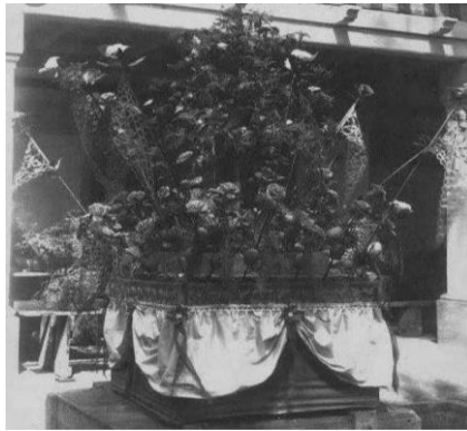
Gambar 5: Pulut Balai di era Kesultanan-1980-an