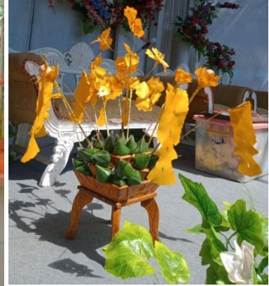
Gambar 10: Pulut Balai yang berisikan Pulut manis (wajik hijau)