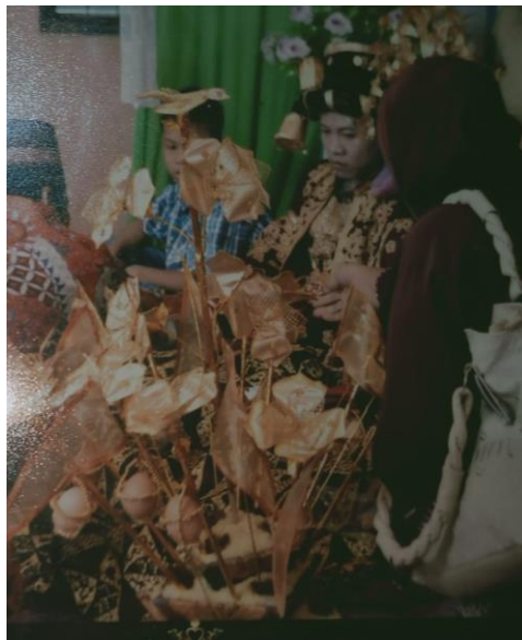
Gambar 7: Pulut Balai di era tahun 2000-an

Mulai tahun 2000-an hingga sekarang, Pulut Balai mulai mengalami pergeseran bentuk yang signifikan. Misalnya saja pada isian Balai , banyak isian balai sekarang diganti sesuai selera si pembuat Pulut Balai ataupun yang memiliki hajat. Ada Pulut Balai yang berisikan rendang daging, pulut inti, atau ikan mas arsik bahkan ada juga yang diisi dengan nasi biasa yang seharusnya adalah pulut kuning/putih dan ayam singgang utuh.