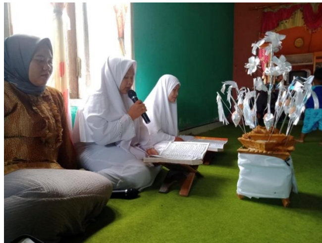
Gambar 3: Pelaksanaan Khatam Al-Qur'an