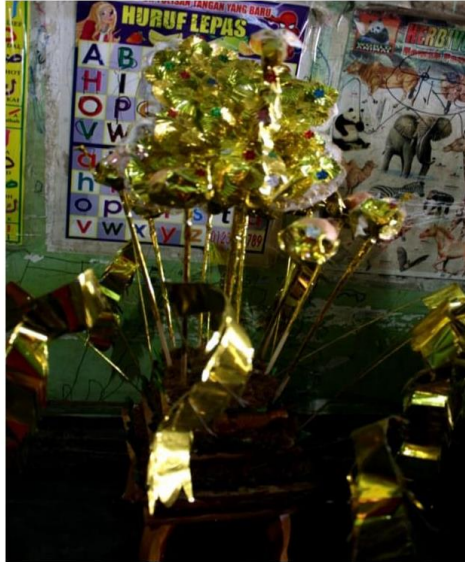
Gambar 11: Pulut Balai dengan hiasan berbentuk burung merak

Allah melarang umatnya untuk menggambar makhluk yang bernyawa. Seperti pada hadist Nabi Muhammad Saw. Dari Ibnu Abbas RA ia berkata Rasulullah Saw. bersabda “ Barang siapa membuat gambar didunia ini, maka Allah akan menyiksanya dihari kiamat dengan memintanya untuk meniupkan ruh kedalam gambar itu, padahal dia tidak akan mampu meniupkan ruh kepadanya ” (HR. Bukhori dan Muslim).