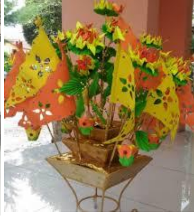
Gambar 9: Pulut Balai dengan hiasan berwarna-warni