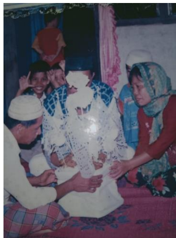
Gambar 6: Pulut Balai di era 1990-an