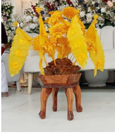
Gambar 8: Pulut Balai yang berisikan daging rendang

tanpa disadari juga budaya tersebut bercampur dengan budaya Melayu sehingga kurang dipahami makna awalnya. Selanjutnya, untuk penggunaan warna saat ini masyarakat biasa bisa menggunakan warna kuning atau emas, yang dahulunya hanya boleh dipakai untuk keluarga kesultanan saja. Sedang paling umum digunakan saat ini adalah Balai bertingkat tiga.