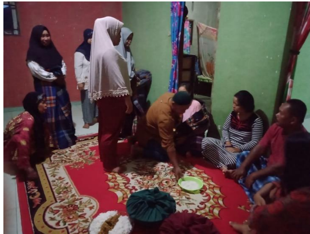
Gambar 2: Pelaksanaan Upah-upah Songgot