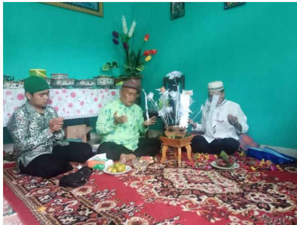
Gambar 4: Pelaksanaan upaca Upah-upah Berangkat Berhaji/Umrah